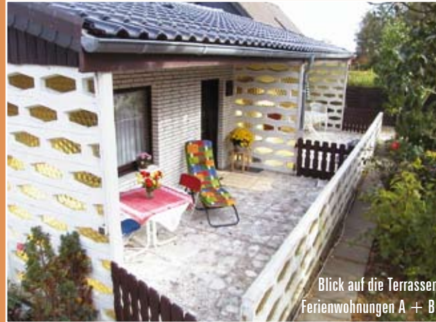
Blick auf die Terrassen Ferienwohnungen A + B.

Mehr Info im Internet: www.ferienwohnung-nordsee.biz