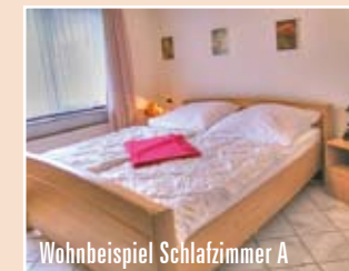
Wohnbeispiel Schlafzimmer A