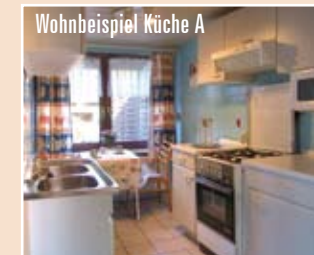
Wohnbeispiel Küche A

Die Ferienwohnungen A + B befinden sich in einem Doppelbungalow nebeneinander. Die Wohnungen sind artgleich - die Ausstattung kann variieren. Alle Abbildungen sind Wohnbeispiele. Die Wohnungen sind komplett gefliest.