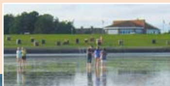
Nur 300 m von den Ferienwohnungen entfernt: Der Strand in Büsumer-Deichhausen.

Mit dem Rad oder dem „Krabben-Express“ sind Sie „im Nu“ in Büsum. Viele Möglichkeiten zu Schiffsausflügen werden angeboten, z.B. zur Hochseeinsel Helgoland, zu den Seehundsbänken oder Fangfahrten mit der „Hauke“. In zahlreichen Fischrestaurants – sogar GOSCH gibt's in Büsum – können Sie Fisch in allen Variationen genießen. In Boutiquen und kleinen Fachgeschäften kann man nach Herzenslust Shoppen. Ein wenig Seefahrer-Romantik erleben Sie – angefangen am Museumshafen – im Hafengebiet, wo die Kutter-Fangflotte die berühmten „Büsumer Krabben“ und frischen Nordsee-Fisch „an Land bringen“. Entspannung für Körper und Seele erhalten Sie im Kur- und Thalassozentrum „Viamaris“.