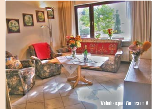
Wohnbeispiel Wohnraum A.

Die Ferienwohnungen A + B befinden sich in einem Doppelbungalow nebeneinander. Die Wohnungen sind artgleich - die Ausstattung kann variieren. Alle Abbildungen sind Wohnbeispiele. Die Wohnungen sind komplett gefliest.